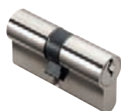
Cylindres panneton rayon 11,4 mm (PM2) p. 28